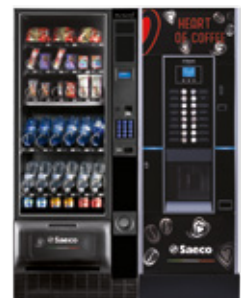
Artico S + Cristallo Evo 400